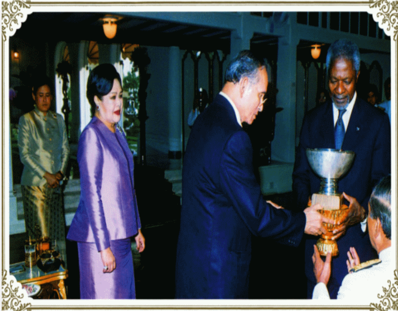
UNDP – Human Development Lifetime Achievement Award (May, 26 th 2006)